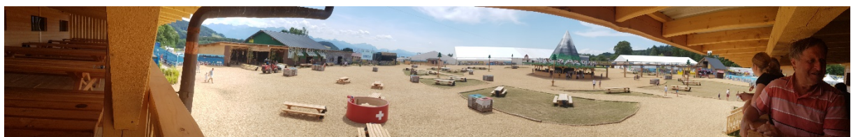
Fête de la jeunesse

Les trois semaines m'ont plu. Je pouvais améliorer mon français. J'ai osé parler français. J'ai bien compris ce que l'équipe et la famille m'a dit. J'ai trouvé mes forces et mes faiblesses grâce à la directrice. J'ai également reçu un certificat. Je recommande faire un stage, mais je pense que si j'étais restée quelques semaines de plus là-bas, mon français serait devenu encore mieux. Mais ça m'a aidé définitivement.