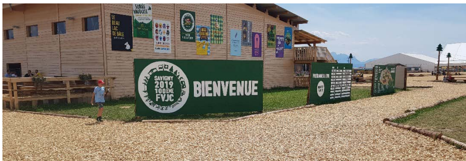
Fête de la jeunesse