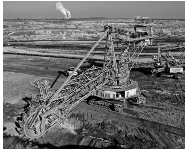
Kohleförderung im Tagebau bei der Region Pödelwitz. Tagebau bezeichnet eine Form der Rohstoffgewinnung, durch die oberflächennahe Bodenschätze gewonnen werden, ohne dass wie im Untertagebau Schächte und/oder Stollen angelegt werden.

Pödelwitz bei Leipzig. Wegen dem darunterliegenden Braunkohlevorrat soll das Dorf mit seinen 130 Bewohnern umgesiedelt werden. Ein paar der letzten Einwohner stehen vor ihrer Kirche aus dem 13. Jahrhundert und blicken über die durch den Tagebau entstandene „Mondlandschaft“.