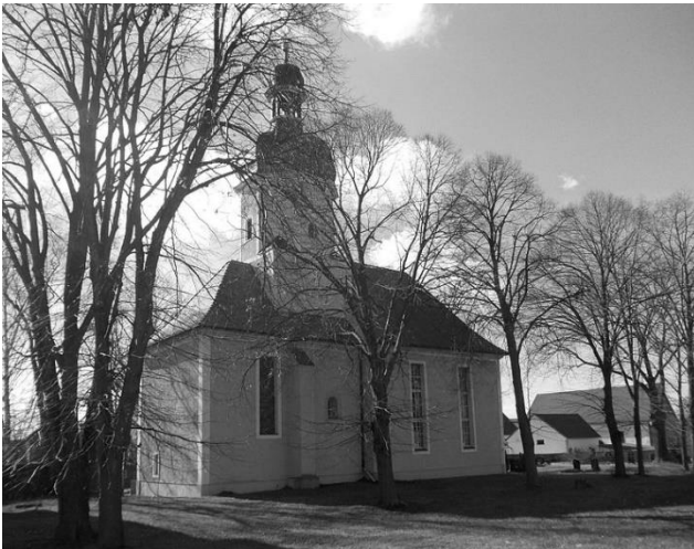
Dorfkirche in Pödelwitz aus dem 13. Jahrhundert