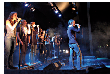
Die Fachschaft Musik

Denn neben Musiktheorie, Gehörbildung, Musikgeschichte, Analyse und dem kreativen Schöpfen von Musik wird bei uns an der Kantonsschule Reussbühl Luzern sehr aktiv Musik gespielt und gesungen. Du wirst an vielen Konzerten mitwirken und diese Aufführungen werden dir noch lange Zeit in bester Erinnerung bleiben, wie zahlreiche Rückmeldungen immer wieder zeigen.