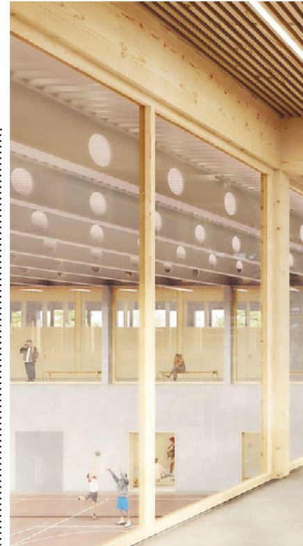
Sportbereich im Erdgeschoss des Neubaus.