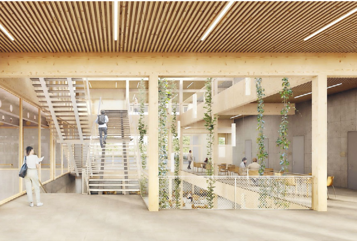
Treppbereich im Neubau.

(Visualisierung: Architekten Gigon und Guyer)