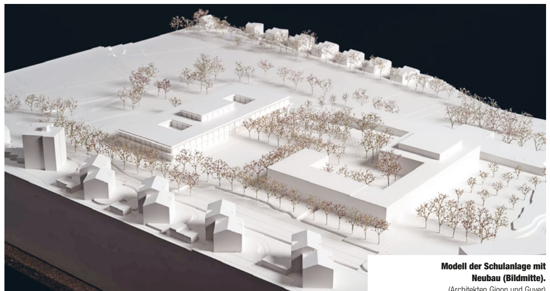
Modell der Schulanlage mit Neubau (Bildmitte).

(Visualisierung: Architekten Gigon und Guyer)