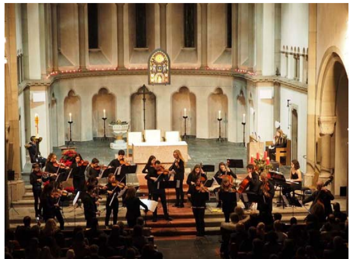
Aufführung des Weihnachtskonzerts am 14.12.2018

Wir danken Ihnen für das Vertrauen, das Sie unserer Schule entgegenbringen, und wünschen Ihnen lichtvolle, frohe Festtage sowie einen guten Rutsch in ein glückliches neues Jahr!