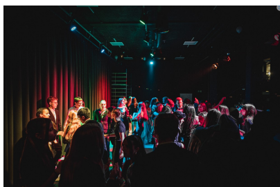
Bild: Ausgelassene, aber friedliche Stimmung im Theaterkeller

Alle unsere 3. Klassen haben die Aufgabe, für die Schulgemeinschaft eigenständig ein Projekt zur Umsetzung einer unserer drei Leitbild-Visionen «KSR verbindet», «KSR kultiviert» und «KSR forscht» zu entwickeln. Die Klasse L22b hatte sich zum Ziel gesetzt, für die Schüler/innen der 3.-6. Klassen und die Lehrpersonen einen Schulball zu organisieren.