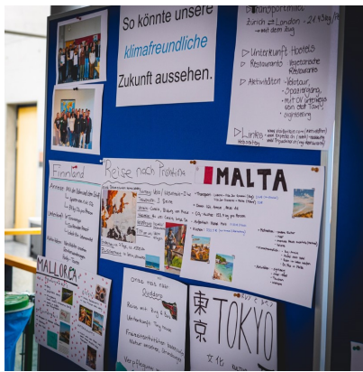
Bild: Erarbeitete Wünsche für klimafreundliches Reisen

20.-24. März eine Klimawoche, in welcher die ganze Schulgemeinschaft für die Auswirkungen des Klimawandels sensibilisiert wurde.