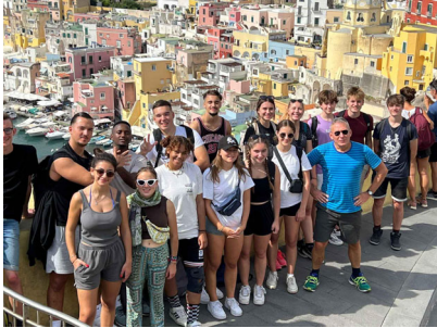
Die Kulturreisenden in Neapel

Wichtige gemeinschaftsfördernde Anlässe sind jeweils auch unsere Studienwochen im Herbst und im Frühling. Die diesjährige Herbststudienwoche fand vom 26.-30. September 2022 statt und stand ganz im Zeichen interdisziplinärer Projekte. Während sich die 2. Klassen mit verschiedenen Facetten der Phänomene «Sucht und Genuss» auseinandersetzten, erfuhren die 3. Klassen, wie mathematische Funktionen in anderen wissenschaftlichen Bereichen wie Chemie, Physik oder Ökologie angewendet werden. In den 4. Klassen wurden zur Vorbereitung auf die