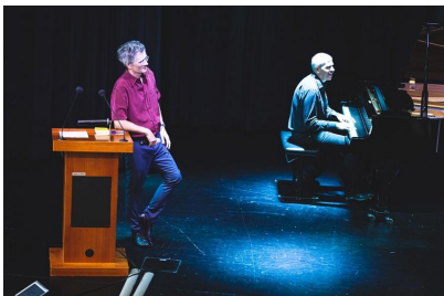
Improphil an der KSR

Am Montag, 22. August 2022, starteten an der KSR 716 Schüler/innen und 93 Lehrpersonen in das neue Schuljahr 2022/23. Für die Schüler/innen der sechs 1. Klassen des Langzeit- und der zwei 3. Klassen des Kurzzeitgymnasiums war es der erste Schultag an der Kanti. Auch für elf Lehrpersonen bedeutete dieser Tag den Antritt einer neuen Anstellung. Wir hoffen, dass alle neuen Schüler/innen und Lehrpersonen sich inzwischen gut an der KSR eingelebt und an den neuen Rhythmus gewöhnt haben. Es hat uns gefreut,