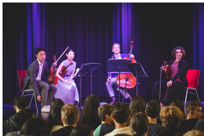
Das Viano String-Quartet

Auch mit Kulturgenüssen wurden wir im ersten Quartal dieses Schuljahres bereits verwöhnt: Seit mehreren Jahren gelingt es unseren Musiklehrpersonen immer wieder, hochkarätige Musiker/innen, die im Rahmen des Lucerne Festival in der Stadt weilen, für Konzerte an die KSR zu holen. Diese Konzerte sind interaktiv konzipiert, so dass die Künstler/innen mit dem Schülerpublikum in Kontakt treten und persönliche Fragen beantworten, was von den Schüler/innen sehr geschätzt und rege genutzt wird. Am 7. September stand für