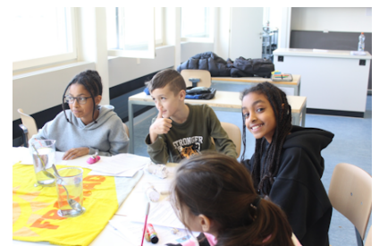
Primarschüler/innen an der KSR