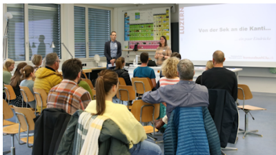
Austauschtreffen Sek. - KZG

Per Anfang März erhalten wir jeweils die neuen Schüler/innen-Anmeldungen für unser Lang- und Kurzzeitgymnasium. Es freut uns, dass wir alle für die KSR angemeldeten Schüler/innen aufnehmen können und weder Umteilungen noch die Auflösung bestehender Klassen nötig sind. So werden wir im nächsten Schuljahr wieder sechs neue 1. Klassen, zwei neue KZG-Klassen und insgesamt 37 Klassen (aktuell 36) führen.