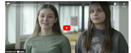
Werbefilm CHANCE KSR (verlinkt)

Inzwischen gibt es das Förderprogramm CHANCE KSR für motivierte Schüler/innen insbesondere mit Migrationshintergrund schon fast ein halbes Jahrzehnt. Zur Finanzierung der vierjährigen Pilotphase durch die UBS Optimus Foundation gehörte auch eine wissenschaftliche Evaluation durch ein Forscherteam der Zürcher Hochschule für Angewandte Wissenschaften (ZHAW). Der umfassende Evaluationsbericht zu CHANCE KSR liegt nun vor und zeigt eindrücklich, dass das Förderprogramm sein primäres Wirkungsziel erreicht: Die Wahrscheinlichkeit, den Verbleib an der Kantonsschule zu schaffen und die Maturität zu erreichen, ist bei den Teilnehmer/innen von CHANCE KSR signifikant erhöht. Wir freuen uns sehr über die positiven Ergebnisse der Evaluationsstudie! Besonders schätzen wir auch die zielgerichteten Handlungsempfehlungen, welche von der Projektleitung nun sorgfältig ausgewertet und im Rahmen der laufenden Optimierung von CHANCE KSR umgesetzt werden. Der Evaluationsbericht ist auf unserer Website einsehbar.