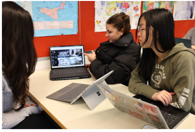
Lernende am Digital Day

Ebenfalls ganz im Zeichen der MINT-Förderung stand der am 13. März erstmals durchgeführte «Digital Day», welcher unseren 4.-Klässler/innen eindrückliche Einblicke in aktuelle Medien- und Informatikthemen bot. So erlebten die Teilnehmenden eine Chat-GPT-Simulation, erforschten KI-Bilder, vertieften ihre Programmierkenntnisse und diskutierten über Trends der Digitalisierung. Vorträge zu ethischen Herausforderungen der KI und zu künstlichen neuronalen Netzen rundeten den Tag ab. Die Veranstaltung förderte nicht nur das Verständnis für die Rolle der Technologie in der Zukunft, sondern festigte auch die