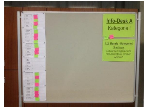
Erste Runde. Die Zulosungen fanden schon statt. Eine Debatte fällt aus.