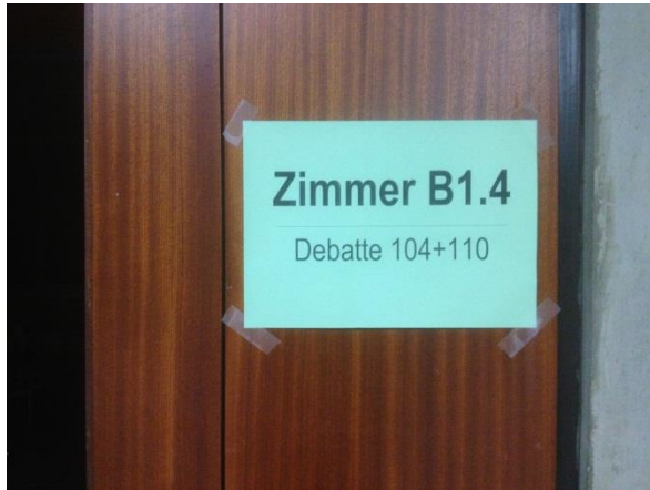
Zimmerbeschriftung. Nicht an der Tür, sondern am Türrahmen rechts.