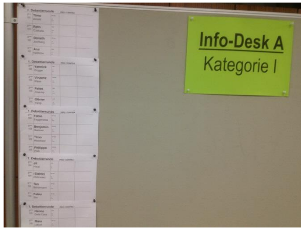
Die Stellwand hinter Info-Desk A mit den Debatten der Kategorie I, erste Runde.