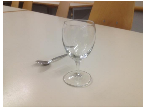
Der Platz des Zeitwächters. Die SchülerInnen stoppen die Zeit meist mit dem Handy.