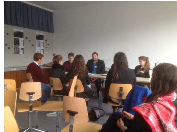
Nach der Debatte und dem Ausfüllen des Meldezettels gibt die Jury den Debattierenden ein Feedback.