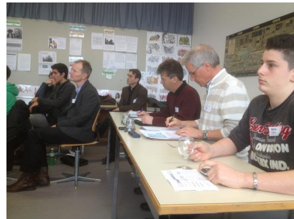
In den ersten beiden Runden jurierten nur zwei Personen. Vorne rechts der Zeitwächter. Die Jury macht Notizen.