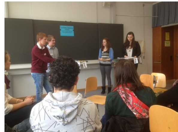
Die Debatte ist in vollem Gang. Das Blatt an der Tafel bezeichnet das verhandelte Thema.