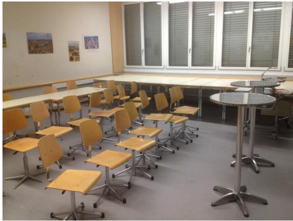
Debattier-Zimmer mit Stehtischen, Glas und Löffel, Jury-Sitzplätze, Signal-Infoblatt, Pro-/ Contra-Zettel an Stehtischen.