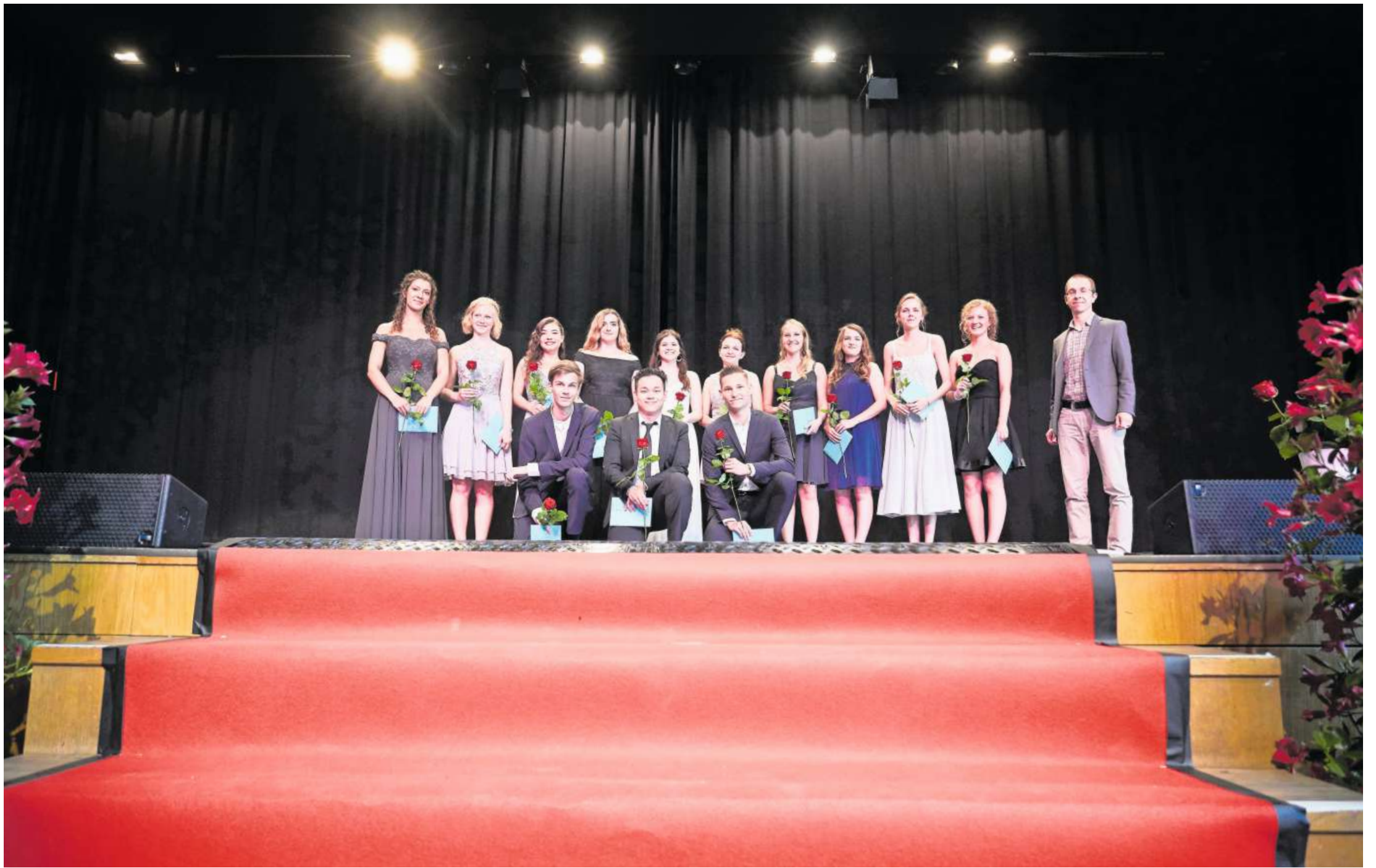
Posieren für das Foto – Schülerinnen und Schüler der Kantonsschule Seetal an der Feier vom Mittwoch in der Braui Hochdorf.

Matura Sieben von neun Luzerner Maturafeiern fanden diese Woche statt. 496 Maturanden und Maturandinnen durften sich über den erfolgreichen Abschluss freuen. Das sind die Namen.